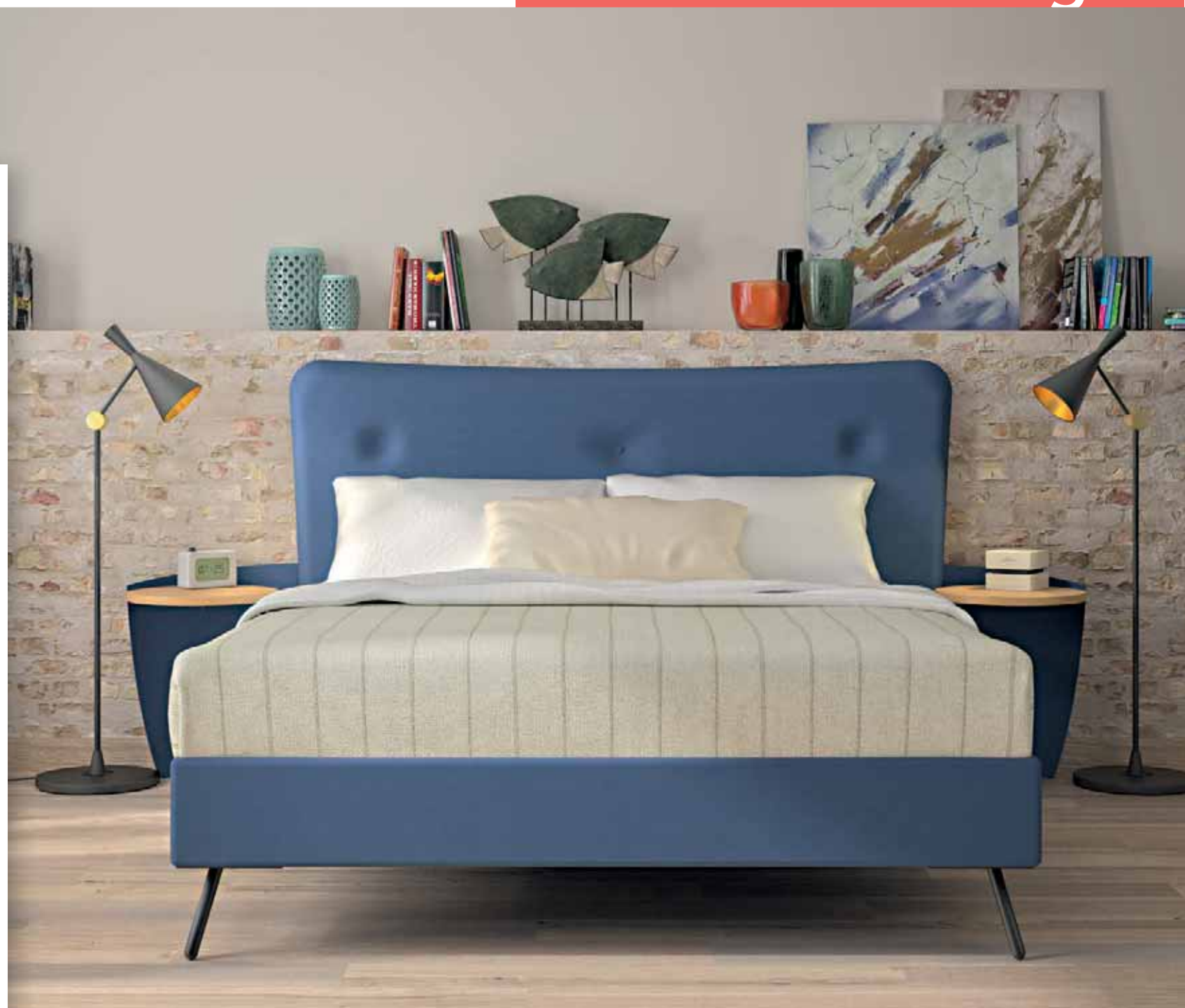
Tête de lit PRAGUE avec sommier RESILATT P20 + pieds inclinés RESILATT – Finition tissu Navy 1850 / métal Encre 2212. Paire de chevets attenants 1676 – Métal Encre 2212 / Chêne Naturel 6717.