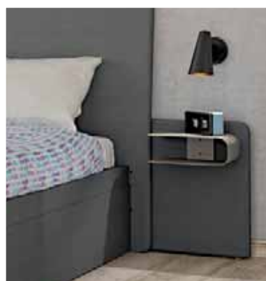
Paire de chevets attenants 1674.