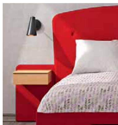
Paire de chevets attenants 1675.